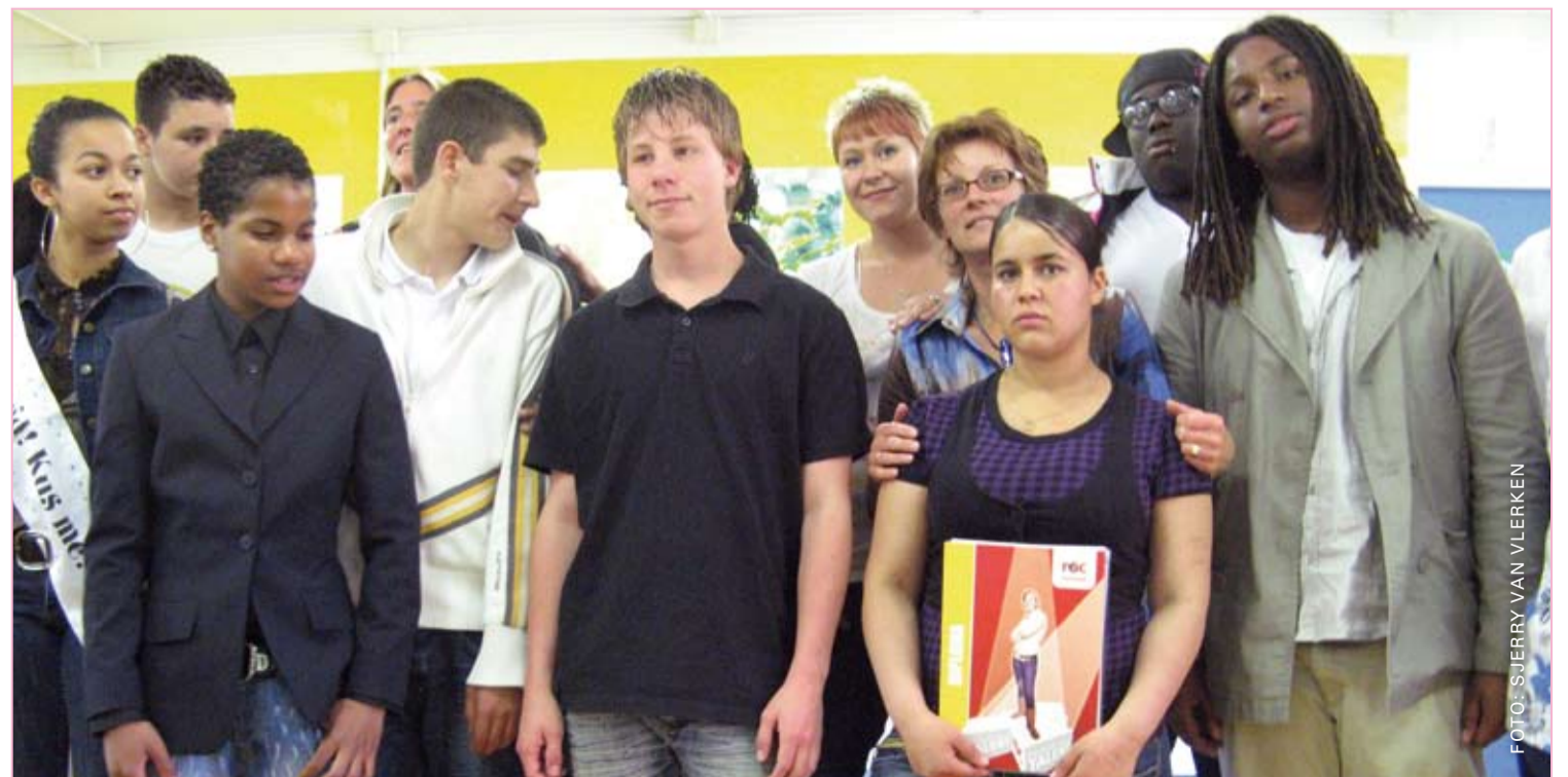
Dat kinderen diploma's en certificaten halen is belangrijk voor hun zelfbeeld.