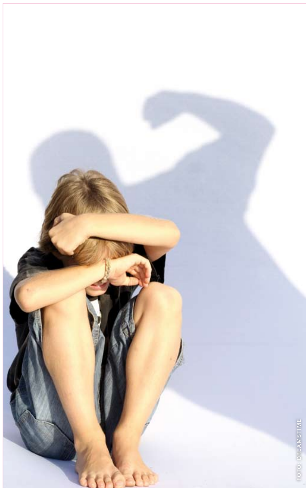
'We hanteren voor een crisis het criterium of een zaak vanwege de veiligheid van de cliënt niet kan wachten op het reguliere traject.' (Foto in scene gezet).

Buiten kantooruren (17.00 – 09.00 uur) kunt u contact opnemen met het Mobiel Crisis Team van Mentrum, tel: 020 – 515 85 78.