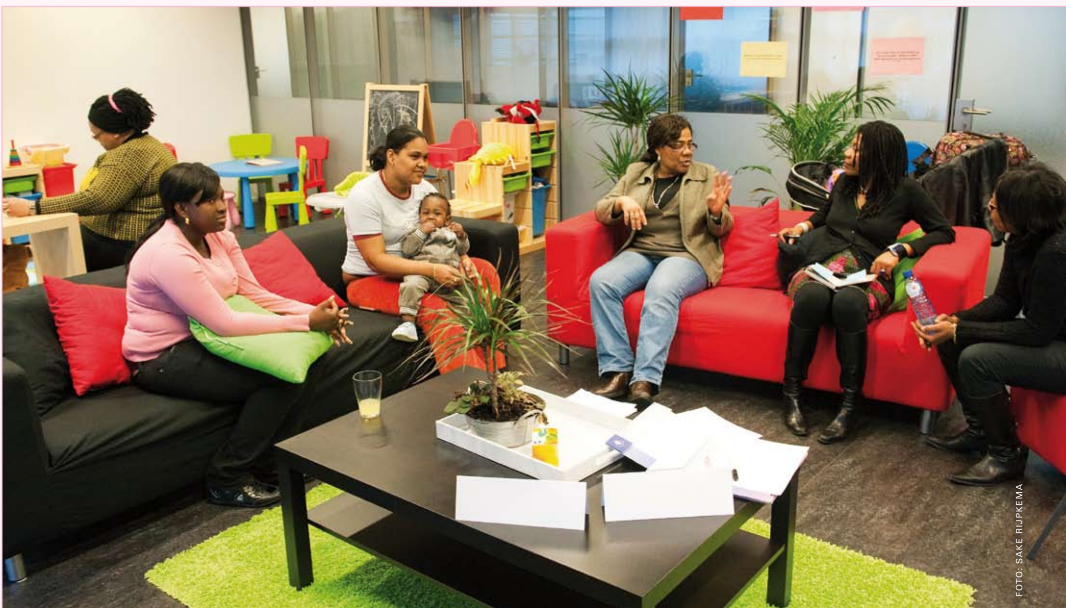
Wie bij Young Parents Zuidoost binnenloopt heeft niet direct het idee in een hulpverleningssetting te komen.

Meer informatie: http://www.minvws.nl/dossiers/subsidies/default.asp