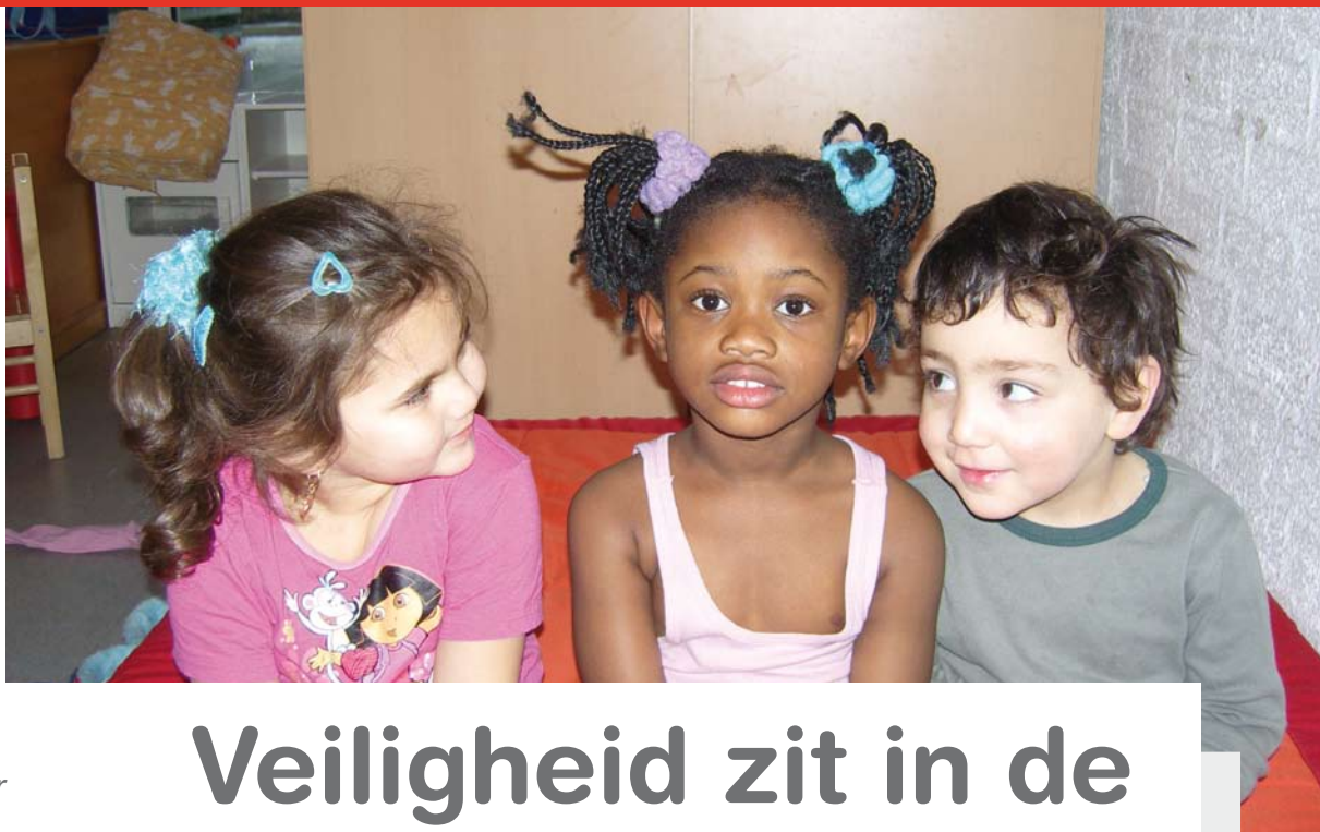
25 % van de cliënten van 't Kabouterhuis is meisje.